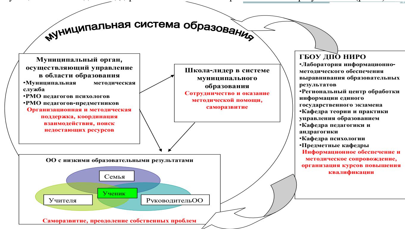
Рис. 2. Муниципальная модель поддержки школ с низкими образовательными результатами.

Составными элементами базовой практико-ориентированной модели поддержки общеобразовательных организаций с низкими образовательными результатами являются муниципальные модели поддержки школ с низкими образовательными результатами (рис. 2)