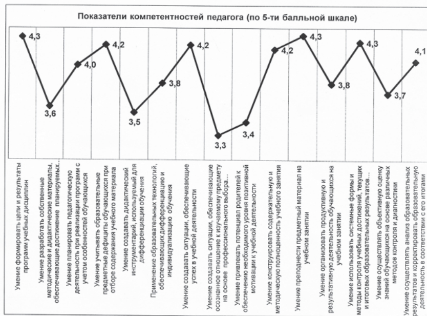
Рис. 3. Уровень развития отдельных показателей компетентностей

обучающихся и ориентированный на их опережающее индивидуальное развитие, а также ориентированный на ликвидацию предметных дефицитов;