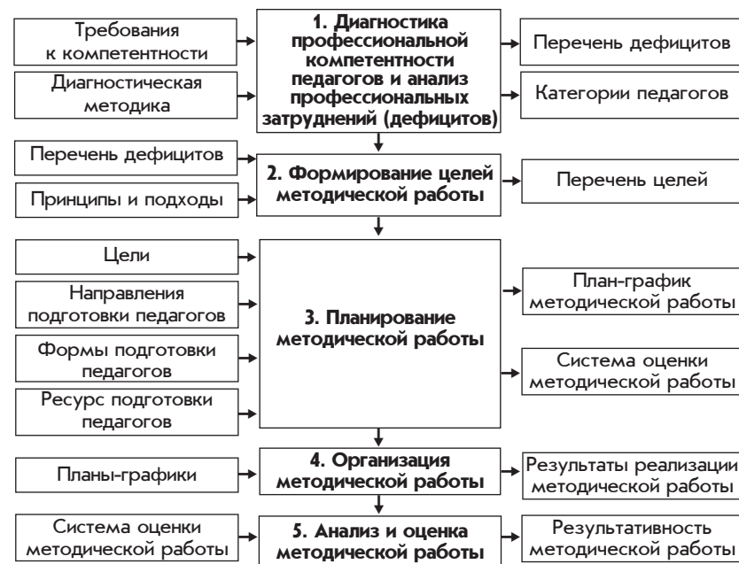
Рис. 2. Алгоритм проектирования методической работы

Проектирование методической работы можно представить в виде алгоритма (рис. 2) [20]. Первый — третий шаги алгоритма связаны с этапом собственно проектирования, то есть разработкой модели методической работы и плана ее реализации на заданный, четко определенный период времени.