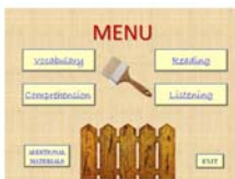
Рис. 3. Интерактивное меню