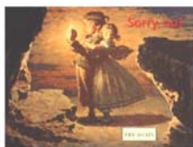
Рис. 4. Сообщения о допущенной ошибке

Для создания эффекта погружения в атмосферу художественного произведения при разработке данного комплекса упражнений нами были использованы аутентичные иллюстрации к «Приключениям Тома Сойера», а также музыкальная композиция John Denver - «Grandma's Feather Bed». Разработанный нами комплекс интерактивных упражнений включает в себя анимированную заставку (рис. 1), краткую справку об авторе произведения (рис. 2) и интерактивное меню (рис. 3), в котором учащимся предлагается четыре вида основных упражнений: дотекстовые, направленные на активизацию новых лексических единиц, упражнения на активизацию лексико-грамматических навыков при работе с текстом, упражнения, направленные на проверку понимания основного содержания, в том числе с элементами аудирования, что позволило на практике реализовать принцип комплексности обучения иностранному языку. Поскольку данная программа предназначена для самостоятельной подготовки учащихся к урокам домашнего чтения, все представленные в ней упражнения предполагают работу над ошибками, то есть многократное возвращение к исходному этапу в случае неверного ответа, сигналом к чему является одна из иллюстраций к произведению (рис. 4).