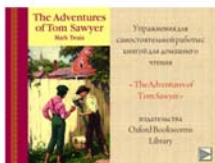
Рис. 1. Анимированная заставка